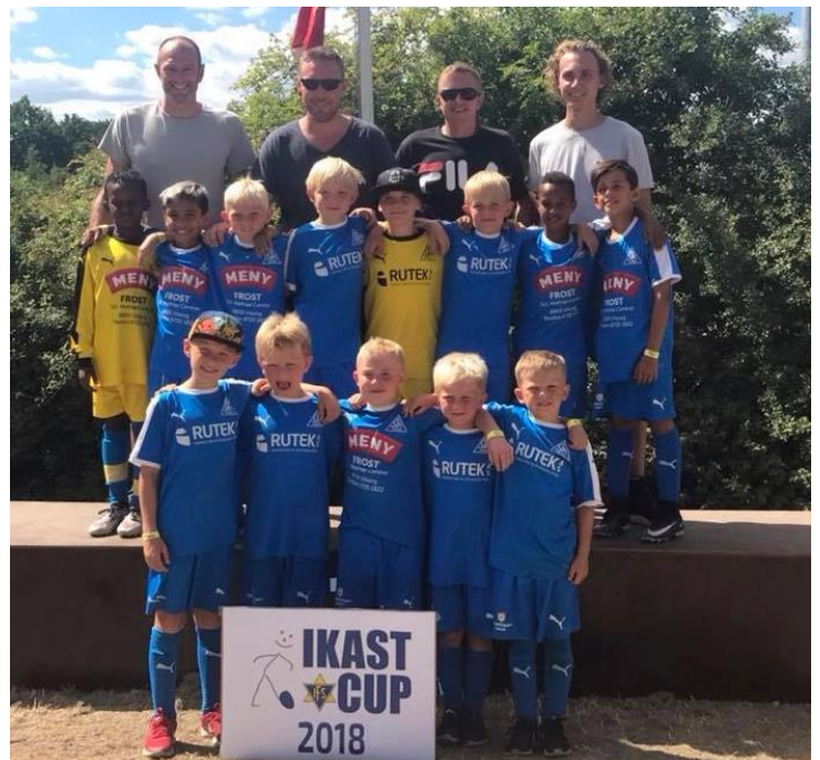
Trænerteamet i U-10 drenge

Det var en rigtig god tur hvor både børn og voksne hyggede og havde en fantastisk oplevelse så dette skal helt sikkert gentages næste år.